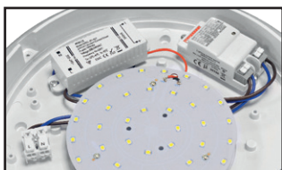
Connecteur rapide double entrée