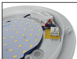
Connecteur rapide double entrée