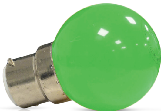
Ampoules incassables (globe en polycarbonate)