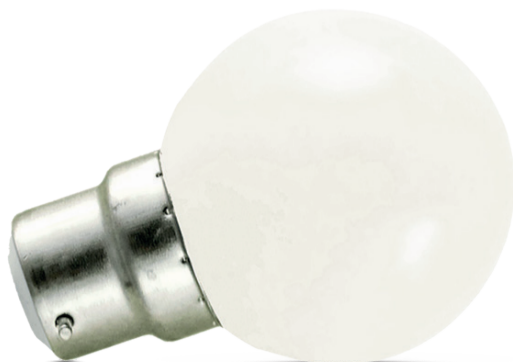
Ampoules incassables (globe en polycarbonate)