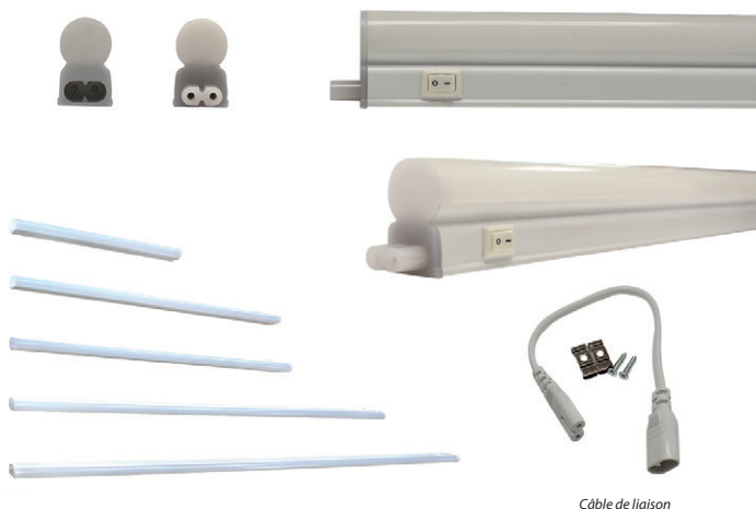
Câble de liaison