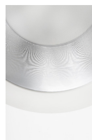
DIFFUSEUR EN ALUMINIUM