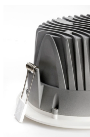
FIXATION PAR CLIPS RESSORTS