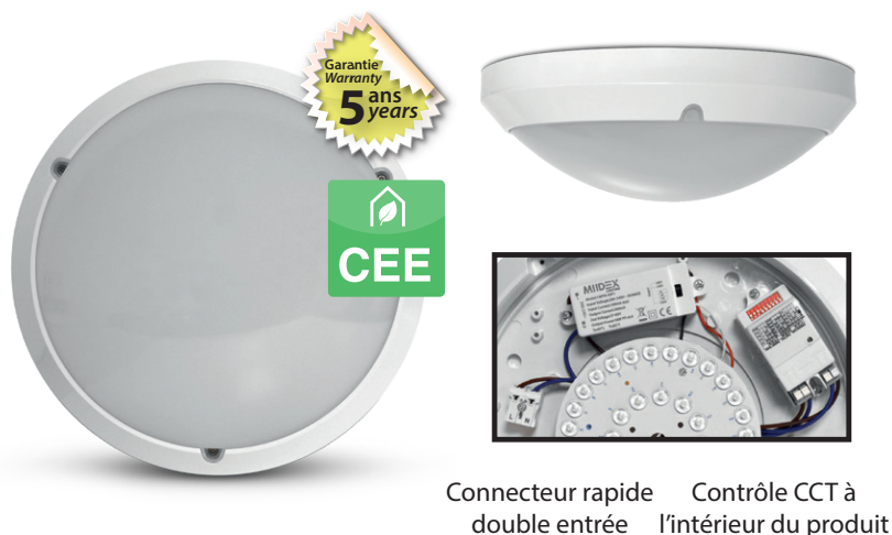
Connecteur rapide double entrée Contrôle CCT à l'intérieur du produit